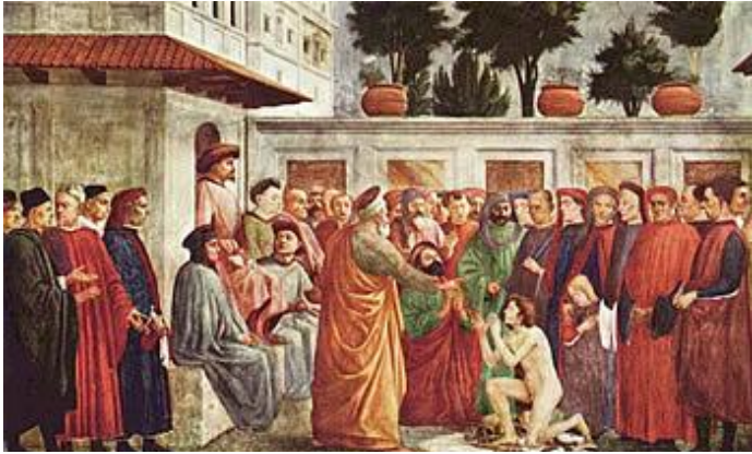
«Воскрешение усопшего апостолом Петром», Филиппо Липпи, XV в.