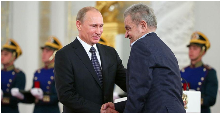
Президент России Владимир Путин и писатель Фазиль Искандер - на торжественной церемонии вручения Государственных премий РФ за 2014 год в Георгиевском зале Большого Кремлевского дворца

– Фазиль Абдулович, когда вы еще были депутатом горбачевского съезда, мы делали с вами беседу о совете мудрецов. Вы тогда выдвигали весьма наивную идею о создании некоего надправительственного совета из безукоризненно честных авторитетных людей, которые будут насаждать в обществе и во власти законы совести.