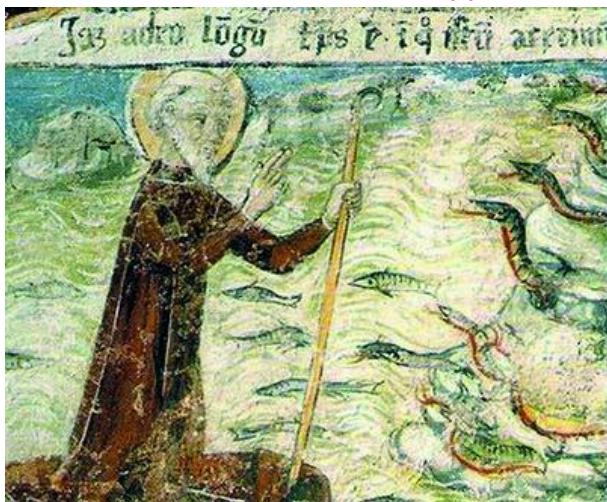
Прп. Иулий изгоняет змей с острова. Роспись церкви прп. Иулия на острове Сан-Джулио, XV в. http://www.npravenc.ru/text/1237871.html