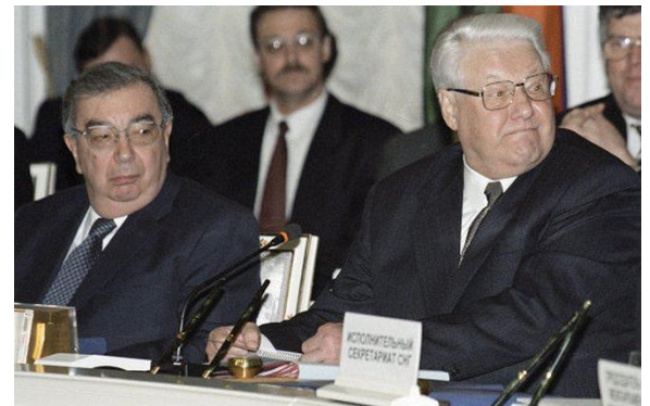
Евгений Примаков и Борис Ельцин

Именно при премьер-министре Евгении Примакове в сентябре 1998 Россия росла, крепла, набиралась экономической мощи. Согласившись с предложением возглавить правительство после дефолта, он выдвинул только одно условие - кабинет он формирует сам. И страна, стоявшая на краю