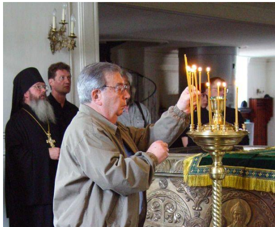
Евгений Примаков на Валааме

В день отпевания Евгения Максимовича игумен Валаамского монастыря епископ Троицкий Панкратий, поделился своими личными воспоминаниями: