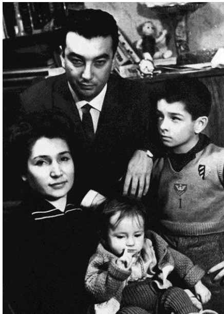
Е.Примаков с семьёй

пропасти, истощенная неплатежами после либеральных реформ, ввергнутая в нищету и двигавшаяся к голодным бунтам, вдруг стала... Вновь заработали заводы, проходные которых успели к тому времени затянуться многолетней паутиной, стала подавать признаки жизни сопутствующая им инфраструктура, зарплату начали вновь выдавать не продукцией или бартером, а деньгами, а государство перестало на полгода задерживать пенсии. И оказалось, что все это мы можем сами, без всякой гуманитарной помощи, без США, без всяких МВФ и возглавлявшего его Камдессю. Он наконец-то решился на то, чего боялись и сильные личности. Прижал олигархов, намекнул о ждущих кое-кого спальных местах, напоминающих нары. Сделать это было необходимо. Смелчак должен был когда-нибудь отыскаться. И участь его была предрешена. Казавшаяся незыблемой олигархия затряслась, объединилась. Примаков мог стать президентом, и от этого кое-кого бросало в дрожь. Нашептали через самых-самых Ельцину близких мерзкую ложь. Через 8 месяцев после назначения на должность Ельцин снял его с поста. Но он