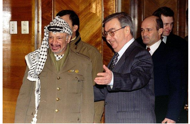
Евгений Примаков и Ясир Арафат

одет и обут. Мама старалась всем обеспечить единственного сыночка, трудилась на двух работах, пропадала там целыми днями. Окончив семь классов школы, стал курсантом (1944г) Бакинского военно-морского подготовительного училища, где успел пройти практику на учебном судне. Однако, спустя два года Е. Примаков был по состоянию здоровья отчислен из училища в связи с выявлением признаков туберкулеза. Продолжил учебу в средней школе, где учителя выделяли его математические способности и склонность к изучению иностранных языков. Эти качества позволили ему в 1948 году после окончания школы поступить в Московский институт востоковедения. В 1953 году он получил диплом специалиста по арабским странам и обучался в аспирантуре экономического факультета Московского государственного университета имени Ломоносова.