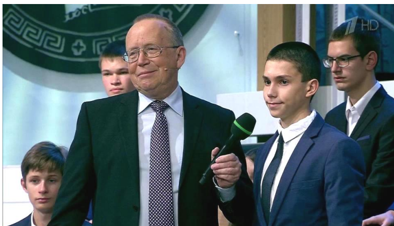
Центральное телевидение, 1 канал. Передача «Умники и умницы»

Юрий Павлович Вяземский – один из наиболее ярких представителей российской интеллигенции. Широкой аудитории он известен как ведущий интеллектуальной программы для школьников под