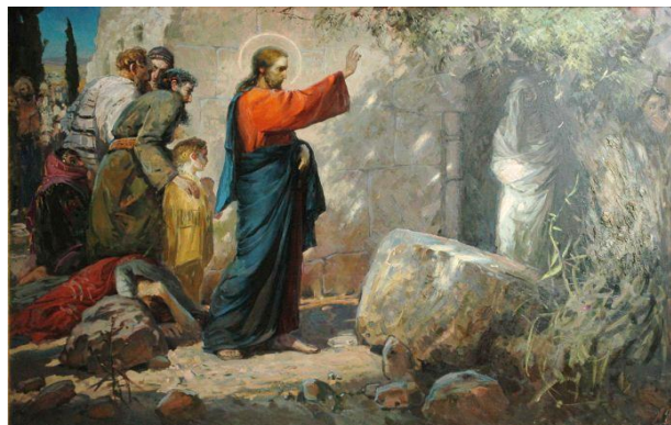
Воскрешение Лазаря.

Свою необыкновенную власть Он демонстрировал еще при своей земной жизни. Он говорил прокажённым: «Очистись!» и тот во мгновение ока исцелялся... Проказа до сих пор (спустя 2 000 лет) окончательно не побеждена современной медициной. Они, бедные, живут в лепрозориях, за высокой стеной, еще не давно их оттуда никуда не выпускали. Они там болели и умирали. Страшная, заразная, неизлечимая болезнь... А Христос одним словом таких исцелял. Христос говорил слепому от рождения, глухому от рождения, немому от рождения: «Исцелитесь!». И они тут же начинали видеть, слышать, говорить. То что – от рождения, как правило, современная медицина