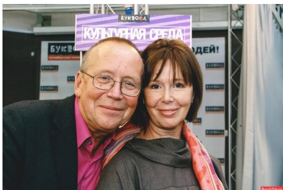
Юрий Вяземский – с сестрой актрисой Евгенией Симоновой.

- Ну конечно, лечит, очень хорошо лечит, но не все. Потому что есть такая боль, которая неизлечима, и это ты носишь с собой и никуда ты от этого не денешься. Это либо смерть очень близкого тебе человека, как это можно вылечить? Мужа или жены. Либо какой-то страшный, сидящий в тебе грех, от которого ты избавиться не можешь, сколько бы раз ты его на исповеди не произносил и сколько бы раз священник тебе, ужасаясь, читал над тобой молитвы. Нет, это сидит в тебе и злеет с каждым годом. Если это тяжелый грех.