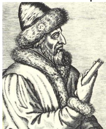
Портрет великого князя Василия III Ивановича. Из французского издания 1584 года.

В 1522 году в княжение великого князя Василия Ивановича было страшное нашествие татар на Унженск. Врагов было свыше двадцати тысяч, а городок был мал и жители в военном деле неискусны. Одна у них была надежда — на Бога и на преподобного Макария Желтоводского, к помощи которого они не раз прибегали в подобных случаях. Укрепляясь этой надеждой, они три дня и три ночи отбивались, от осадившего город неприятеля.