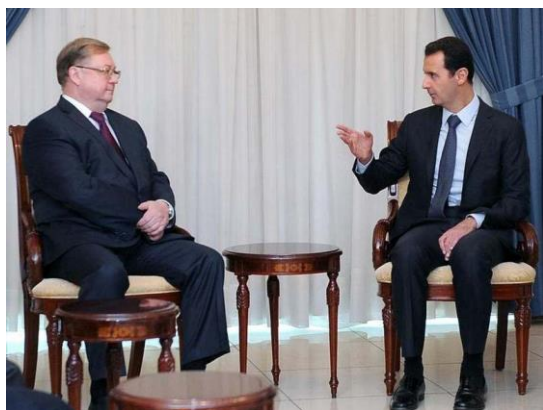
Сергей Степашин и Башар Асад

— Что касается Сирии — это не просто надежда. Напомню, что шесть лет назад, когда, честно говоря, на Сирии поставили крест и когда — готовилась эвакуация нашего посольства, состоялся мой визит в Сирию с гуманитарной помощью. Мы отправили восемнадцать гуманитарных грузов, причем не было