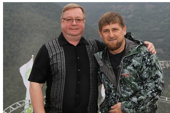
Сергей Степашин и Рамзан

начальник контрразведки, еще в плен тебя поймут, вот бы позорище было! И Вы знаете, что меня больше всего поразило, я не забуду это никогда: с белыми флагами идет огромное количество русских людей. Мы там бомбили в основном центр Грозного, где жили русские люди. Честное слово, если бы не был православным, пулю в лоб бы себе пустил — от позора и стыда. Вот тогда, конечно, обо многом подумал в этой жизни, что все эта суета, это же люди, Господи, у каждого свой дом, семья. Это тебе не за звание, не за звезды бегать, троекратно кричать раскатистое «ура». Это действительно было очень серьезное испытание.